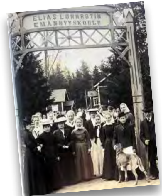
Kuva, Sammatti Elias Lönnrotin kotipitäjä teos